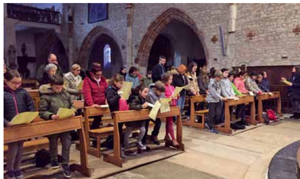
Messe de l'aumônerie à Lasseube.

Nous avons conclu cette belle journée par la messe. Ghislaine et les enfants de l'éveil à la foi, quelques parents et paroissiens se sont joints à nous. La messe était célébrée par