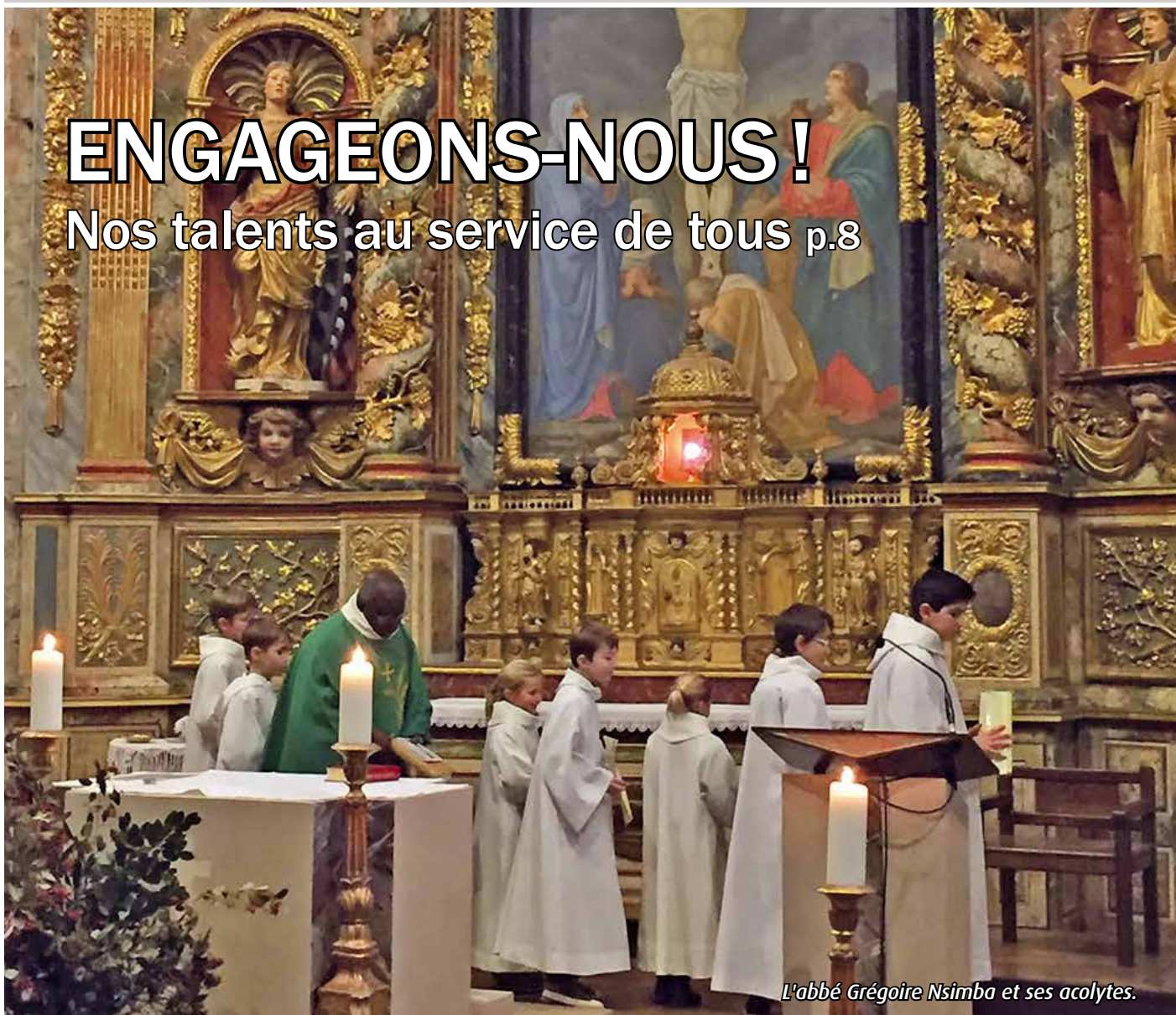
L'abbé Grégoire Nsimba et ses acolytes.

Votre journal La Chaîne en danger PAGE 2