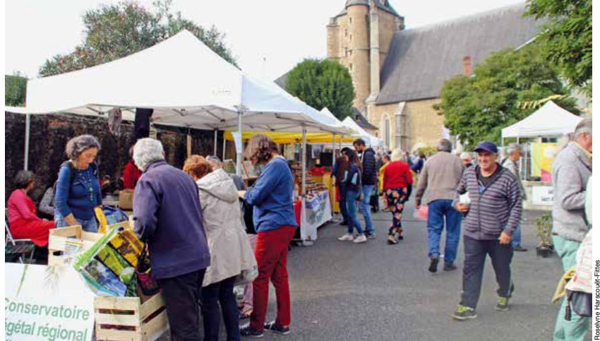
Bio Casaü a investi la rue et la salle Saint-Girons.