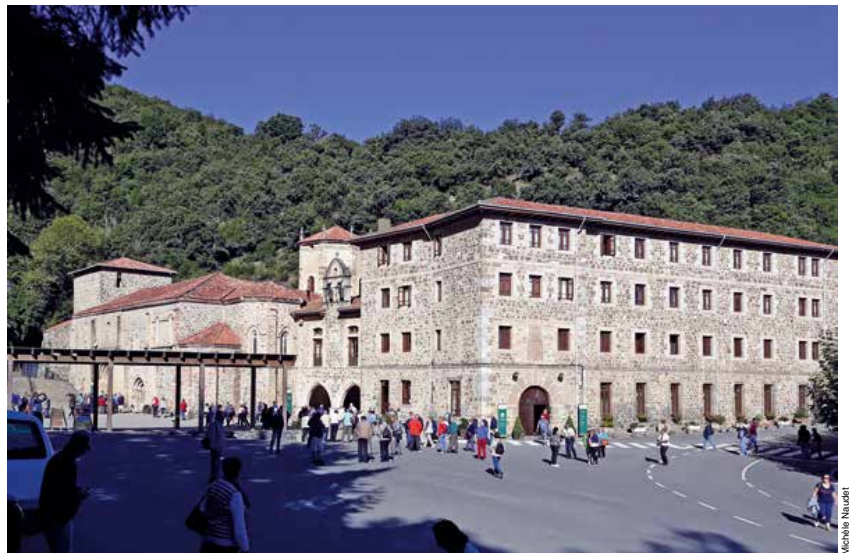
Le monastère de Santo Toribio de Liébana.