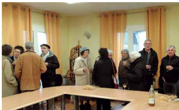
Convivialité pour la Sainte-Agathe.