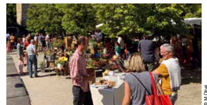
Le marché dominical de Lucq-de-Béarn.

Il est dix heures, les odeurs de poulet commencent à se propager. Les légumes, les fromages, le pain, le miel colorent la place de l'église, au pied de la Tour de l'abbaye. Le marché de Lucq s'éveille tranquillement, au rythme des premiers chalands.