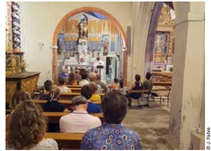
Messe de l'Assomption.

L'autel de la Vierge Marie récemment restauré a attiré de nombreux vacanciers cet été. Habituellement, nous sommes sept à huit fidèles pour la célébration de la messe en semaine.