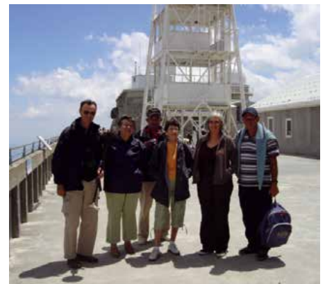
Visite de l'observatoire du Pic du Midi.

La nuit se perd : même en plein désert, le ciel sera-t-il assez noir pour un œil électronique ? Le droit international est appelé à se construire au sujet de l'utilisation de l'espace : des risques de collision viennent s'ajouter à la perte de nuit (en avril dernier, Thomas Pesquet et