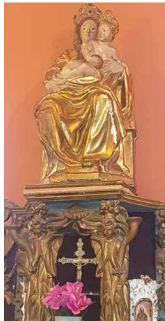
La Vierge de Cardesse.