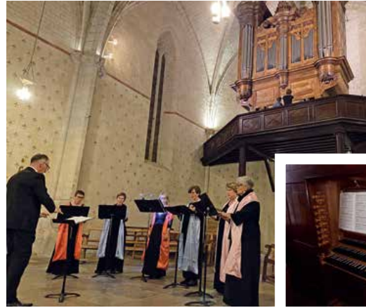
Échange vocal entre l'orgue et le chœur.