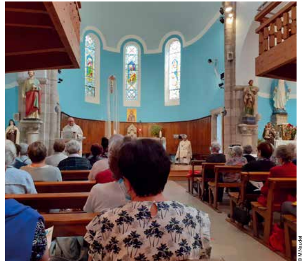
Messe de rentrée au MCR.