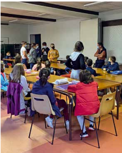
Les enfants, adolescents et animateurs.

C'est la reprise du KT pour nos jeunes qui vont continuer à cheminer dans la foi.