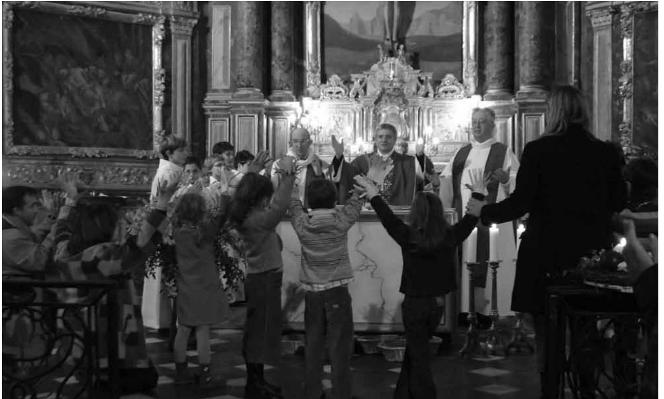
Autour de l'autel pour le « Notre Père »