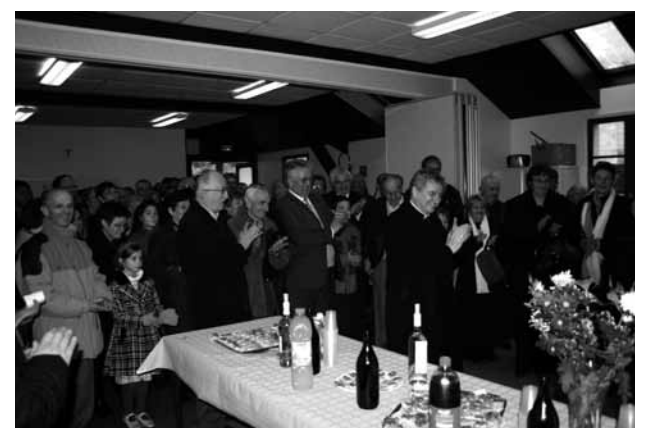
Les applaudissements après l'accueil des jeunes.

Notre évêque à Monein, ce fut l'occasion pour les jeunes de l'aumônerie de montrer ce dont ils étaient capables.