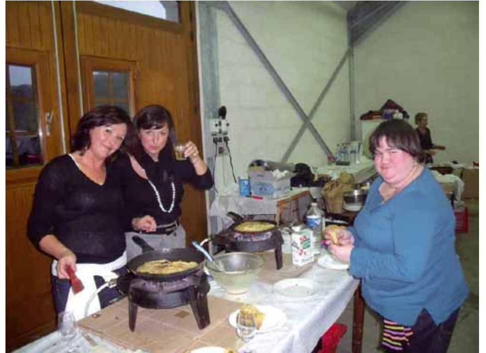
La cuisson des crêpes