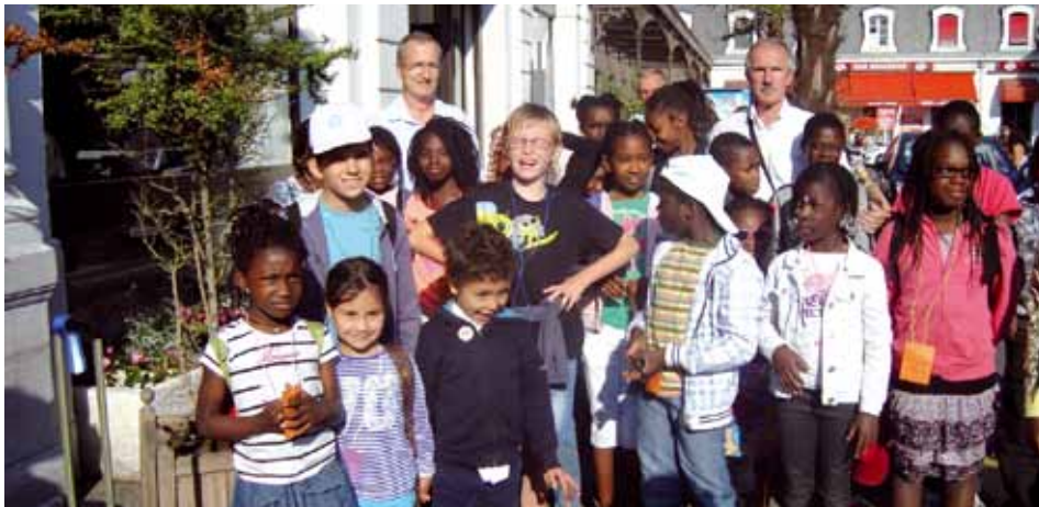
Arrivée des enfants à Pau.

Tous les ans, la délégation du Secours catholique des pays de l'Adour accueille en Béarn des enfants pour qu'ils puissent passer de vraies vacances au moins une fois dans l'année. Pour que l'Accueil familial de vacances (AFV) soit possible, le Secours catholique doit trouver des familles prêtes à partager avec les enfants un peu de leur vie quotidienne pendant trois semaines au mois de juillet. Les enfants accueillis viennent des délégations